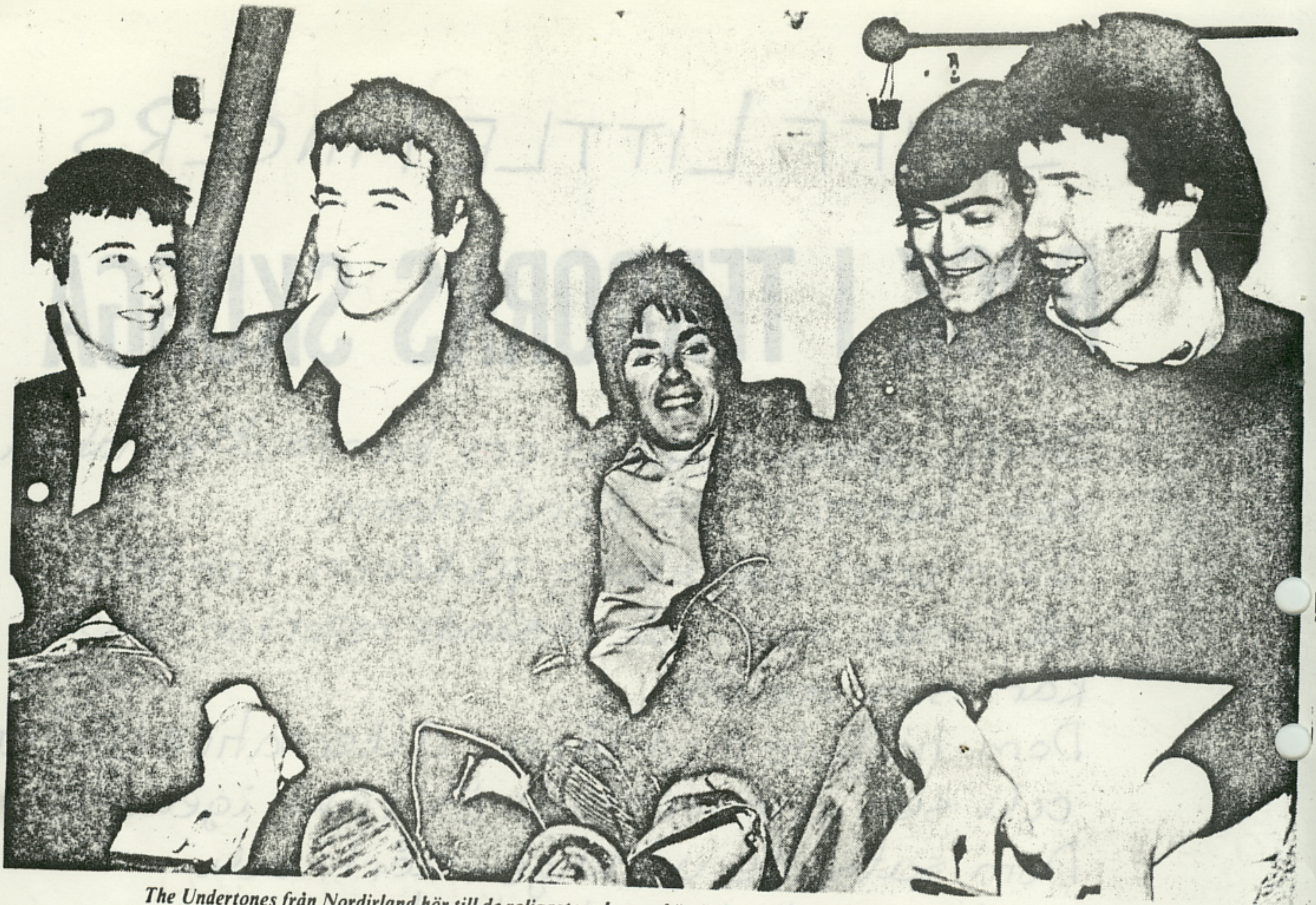
The Undertones från Nordirland hör till de roligaste och mest hörvärda av dagens nya-vågen-grupper. De fem unga musikerna utstrålar en frigörande entusiastisk lekfullhet som är svår att motstå.